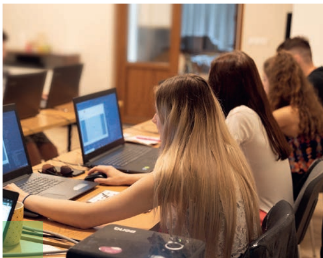
Uczestnicy projektu podczas szkolenia komputerowego

tel. 690 980 060, 81 744 49 74 e-mail: barwyziemi@interia.eu www.postaw-na-prace.com.pl