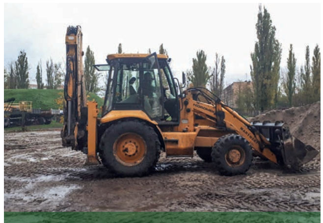
Kurs operatora koparko-ładowarki zorganizowany przez PUP w Gorzowie Wielkopolskim